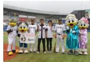
2012年7月7日(土) 千葉ロッテマリーンズ