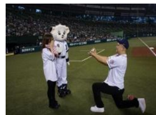
2012年5月25(金) 埼玉西武ライオンズ