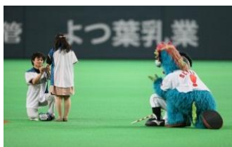
2012年6月5(火) 北海道日本ハムファイターズ