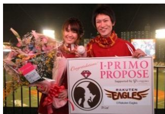
2012年4月25日(水) 東北楽天ゴールデンイーグルス

パ・リーグ6球団の各球場で、サプライズあり涙ありの感動のプロポーズが生まれました！