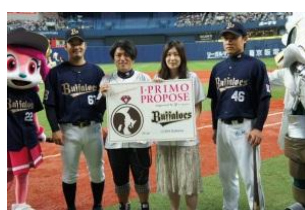
2012年6月17日(日) オリックス・バファローズ