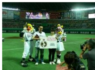
2012年5月22(火) 福岡ソフトバンクホークス