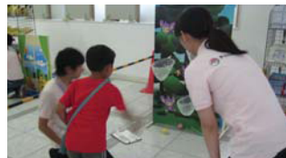
2 エイパムのきのみキャッチ