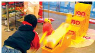
1 ピカチュウのボルテッカー!