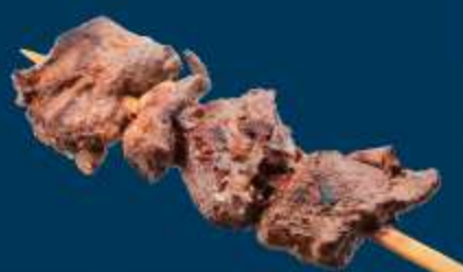
牛串 Skewered Beef 1,500円