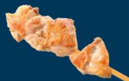
鶏串 Skewered Chicken 800円