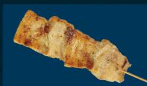
一志SPポークの 豚バラ串 Skewered Pork 900円