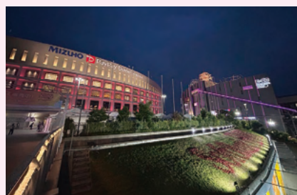
みずほPayPayドーム福岡