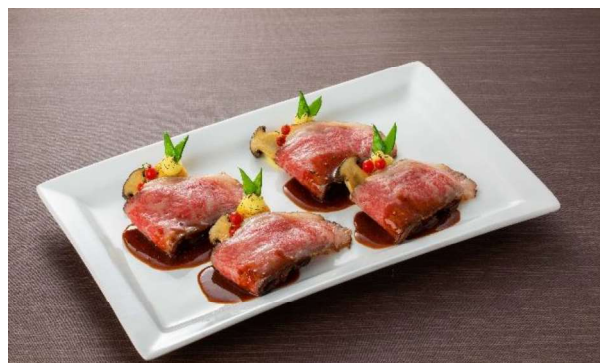
黒毛和種佐賀牛ローストビーフ (4名盛) 13,500円 (税・サービス料込)