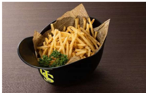
ヘルメットポテト (5~6名盛) 2,300円 (税・サービス料込)