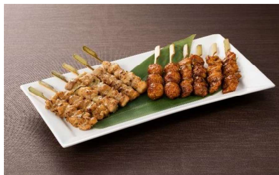
焼鳥盛合せ(12本) 3,000円 (税・サービス料込)