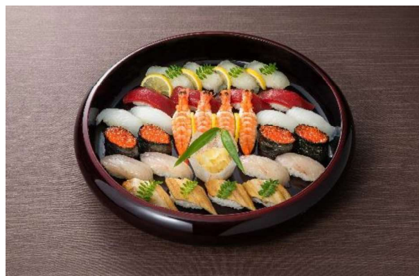
上にぎり盛合せ (4~5名盛) 14,000円