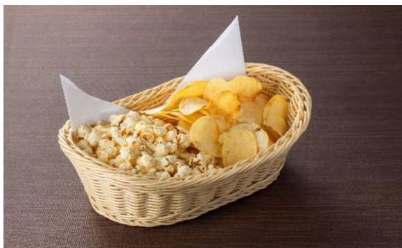
ポップコーン&ポテトチップス(4~5名盛) 1,500円 (税・サービス料込)