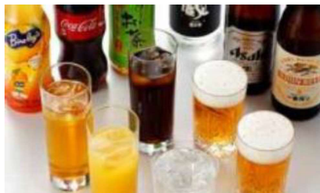
フリードリンク お一人様3,000円 (ビール (生・瓶) /焼酎・ワイン・冷酒・ソフトドリンク) お子様フリードリンク お一人様1,500円 (ソフトドリンク)