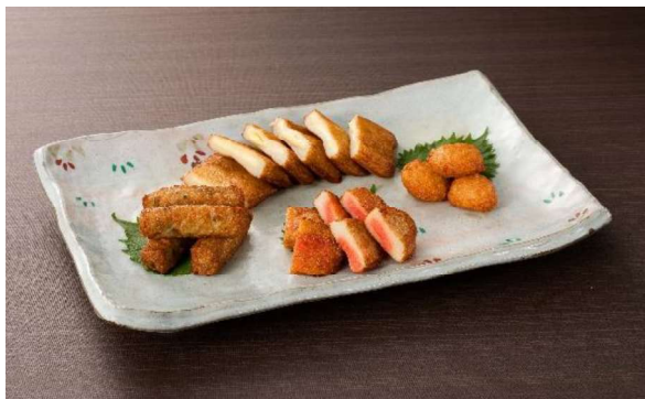
さつま揚げ盛合せ (4~5名盛) 3,800円 (税・サービス料込)