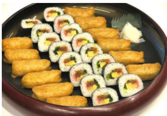
助六寿司 (4~5名盛) 5,000円