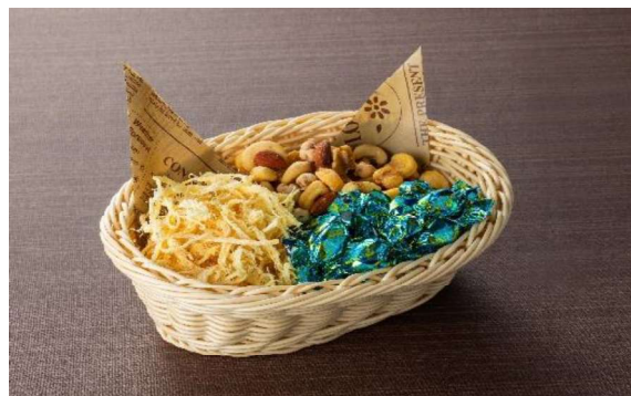
ドライスナック盛合せ (4~5名盛) 1,800円 (税・サービス料込)