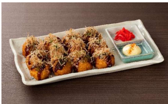
たこ焼き(12個) 1,500円 (税・サービス料込)