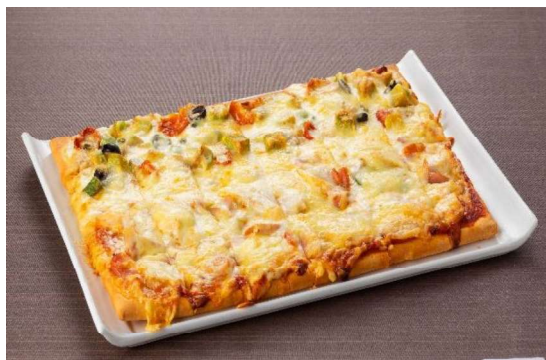
スペシャル2色ピッツア (5~6名盛) 4,200円 (税・サービス料込)