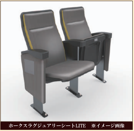
ホークスラグジュアリーシートLITE ※イメージ画像