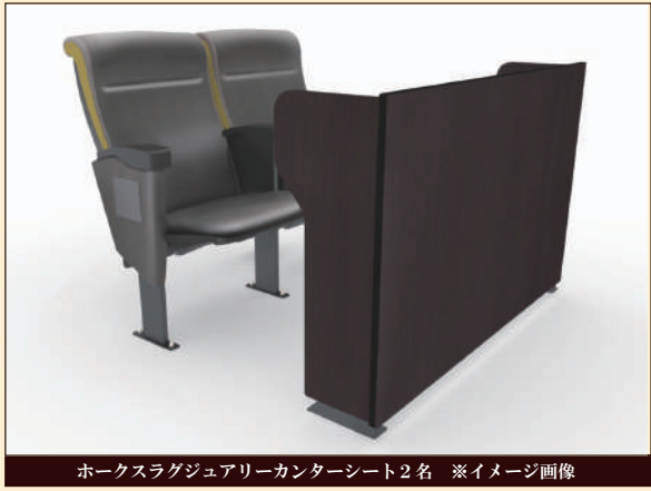
ホークスラグジュアリーカウンターシート2名 ※イメージ画像