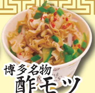
博多名物 酢モツ 500円