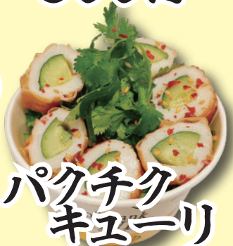
パクチク キューリ 500円