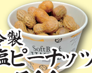
冷製 塩ピーナッツ 500円