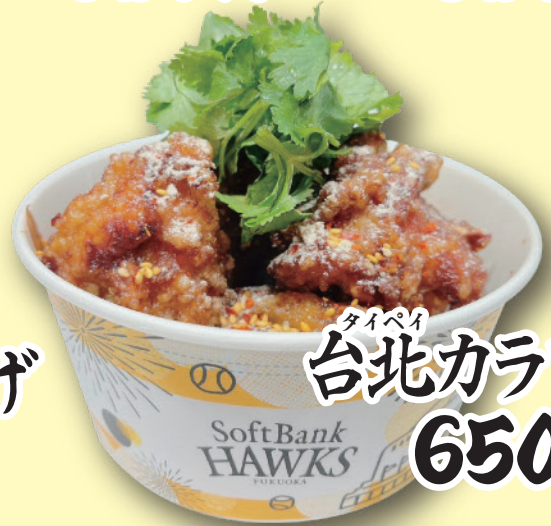
台北カラアゲ(6ヶ) 650円