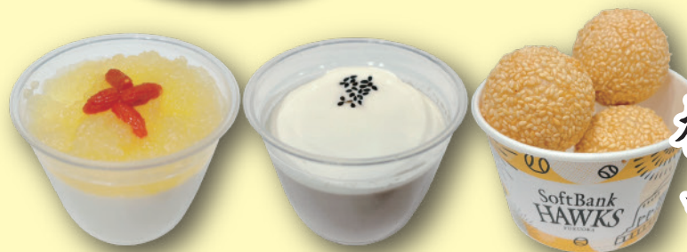
林檎のト品杏仁豆腐・黒胡麻杏仁 胡麻団子(3ヶ) 各種 450円