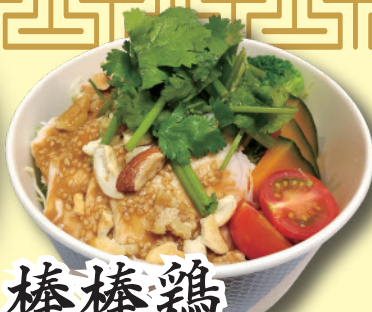
棒鶏 ナッツサラダ 680円