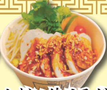
よだれ鶏サラダ 680円