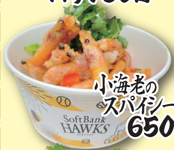
小海老の スパイシー揚げ 650円